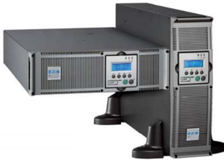
Eaton MX - Vielseitigkeit