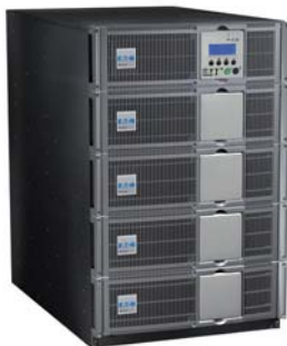
Eaton MX Frame